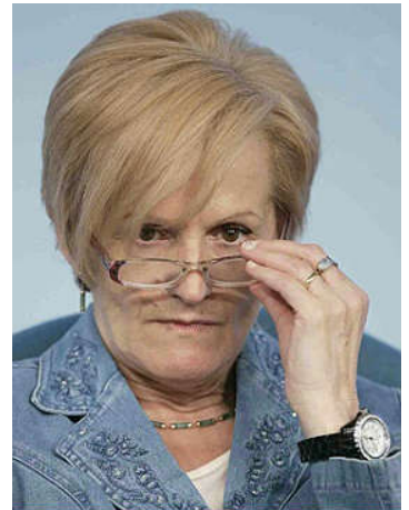
On. Livia Turco