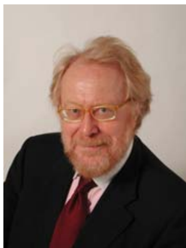
On. Paolo Guzzanti

Il 19 marzo si è tenuta, in una saletta del Senato, la conferenza stampa durante la quale il Sen. Paolo Guzzanti (PdL) ha annunciato, se eletto, di voler presentare una disegno per la modifica della L.180. Tale iniziativa sarà un caposaldo della sua azione parlamentare nella nuova legislatura ormai imminente. Tale dichiarazione ha scatenato una tempesta nel mondo politico, ove i paladini della L.180 avevano preparato la solita sviolinata della legge ed il solito pacchetto di promesse d'assistenza alle famiglie, pacchetto sistematicamente rinnovato ed insabbiato nei 30 anni di vita della L.180. La tempesta scatenata dall'iniziativa, comunque, non è stata inutile. I 50 "lanci" dedicati all'evento dalle grandi agenzie di stampa (ANSA - AGI - ADN Kronos - ecc) hanno risvegliato il partito di Berlusconi dall'inerzia in cui lo aveva fatto piombare il Ministro della Sanità Gerolamo Sirchia nella legislatura del 2001-2006 e, la revisione radicale della L.180, chiesta dal Sen. Guzzanti, è stata ufficialmente inserita nel Programma del PdL in campo sanitario. Conosciamo Guzzanti e faremo tutto il possibile per stimolarlo