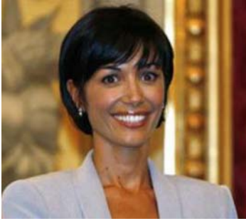
Ministro Pari Opportunità On.le Mara Carfagna