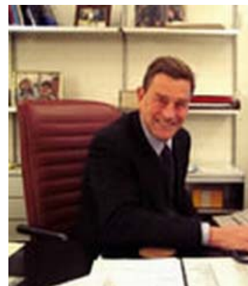
On. Ferruccio Fazio

L'On. Ciccio continua la sua battaglia intervenendo in tutti i dibattiti, soprattutto quelli organizzati dalla Sinistra, per confermare la sua volontà di far proseguire l'iter della sua proposta di legge. Mentre gli psichiatri basagliani più estremi sono in allerta per difendere in tutti i modi lo status quo, in alcuni ambienti della Sinistra si intravedono ammissioni di lacune e si notano segnali di apertura per la discussione della proposta di legge. L'On. Ciccio ci comunica che purtroppo in questo periodo c'è stato un intasamento di leggi urgenti che hanno fatto slittare quelle ordinarie. Comunque egli conta di portare entro giugno in discussione alla Commissione, la sua proposta di modifica della Legge 180.